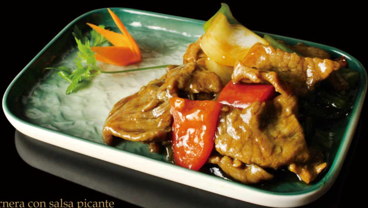
51. Ternera con salsa picante Beef hot sauce