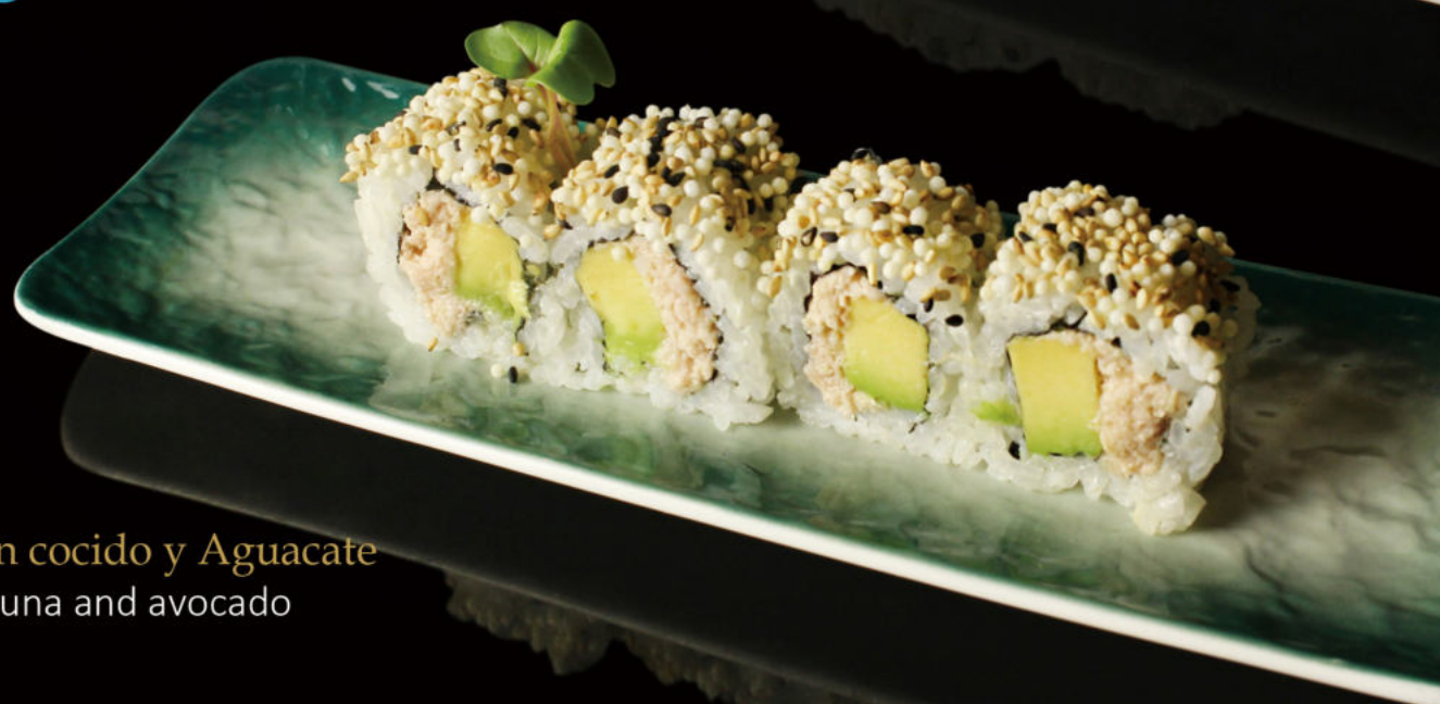
155. Atún cocido y Aguacate Cooked tuna and avocado