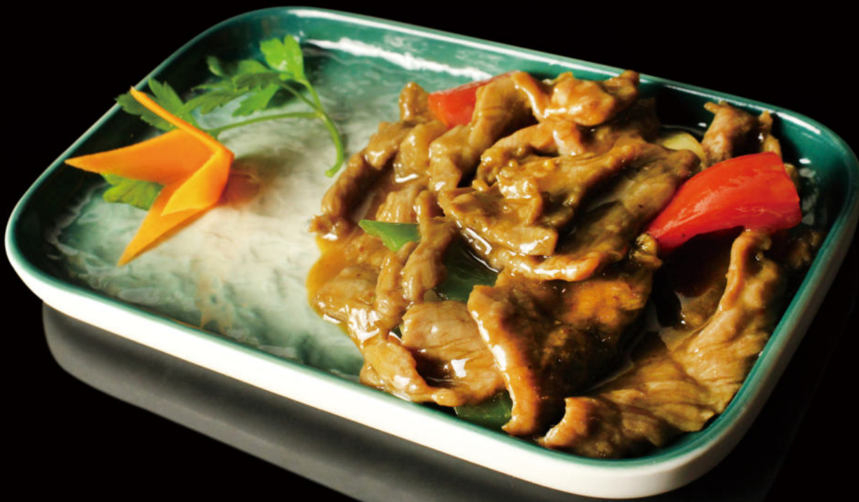
50. Ternera con salsa de Ostras Veal with oyster sauce