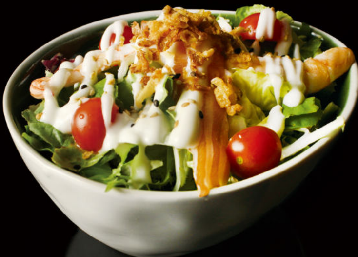
4. Ensalada marisco Seafood Salas