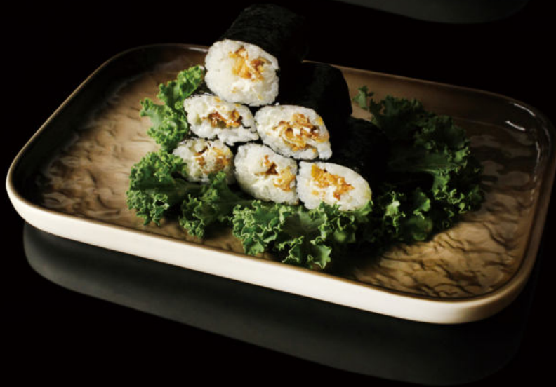
76.Cebolla con queso (8u) Onion with cheese