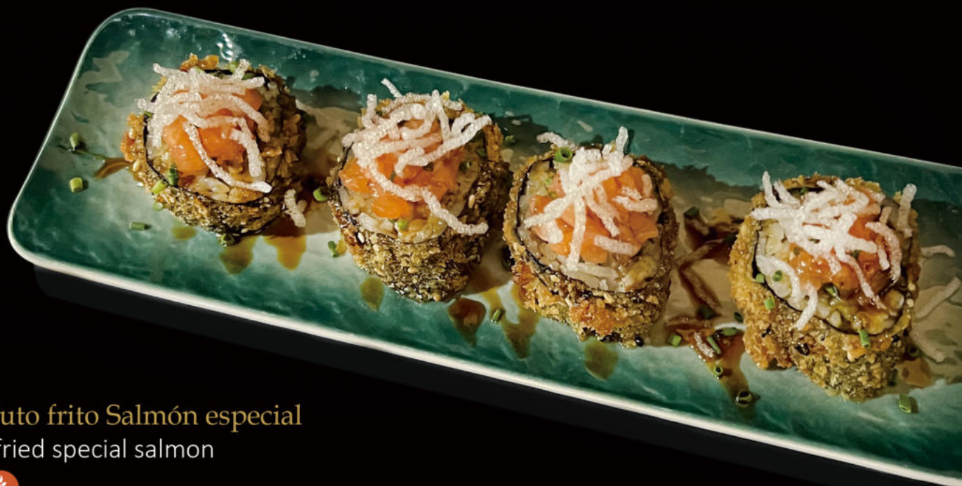
169. Futo frito Salmón especial Futo fried special salmon