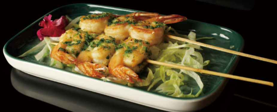
32.Pincho de Gamba (2u) Prawn skewer