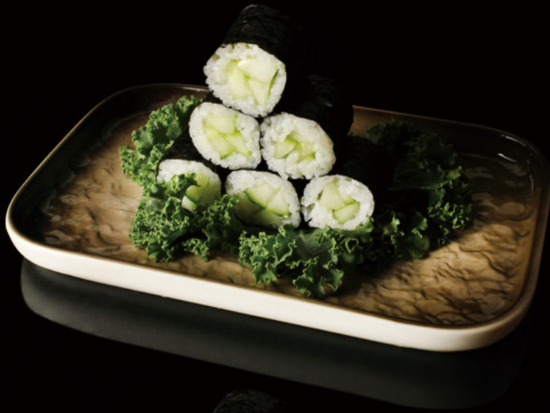
75.Pepino (8u) Cucumber