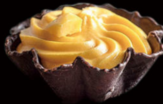
502. Helado flor de mango Mango flower ice cream