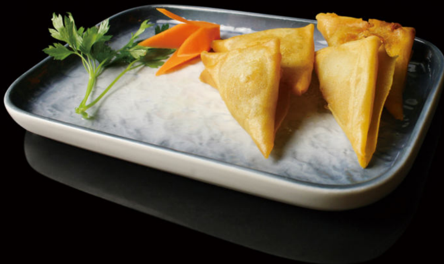
34.Triângulo de Curry Curry triangle