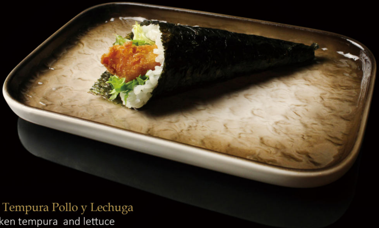
143. Tempura Pollo y Lechuga Chicken tempura and lettuce