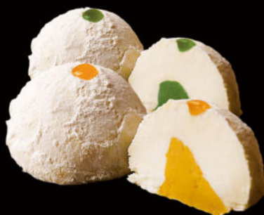
523.Mochi helado (mango y coco,té verde) Ice cream mochi (mango and coconut, green tea) 4.80€