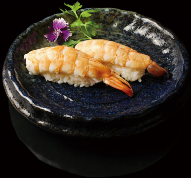
84. Langostino (2u) Prawn