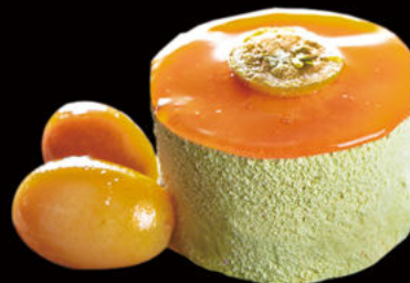
508. Té verde y mandarina tentación helado Green tea and tangerine ice cream temptation