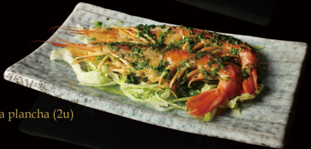
61. Gambón a la plancha (2u) Grilled shrimp