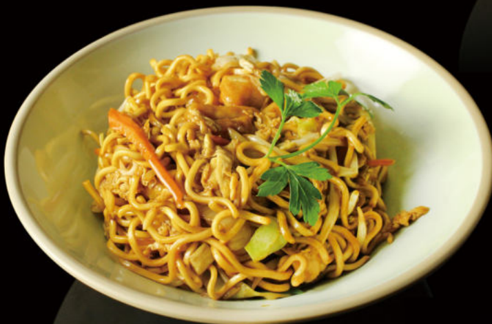
38. Yakisoba Pollo Chicken fried rice