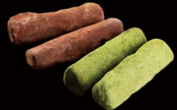
506. Trufas japonesas (té verde, chocolate) Japanese truffles (green tea, chocolate)