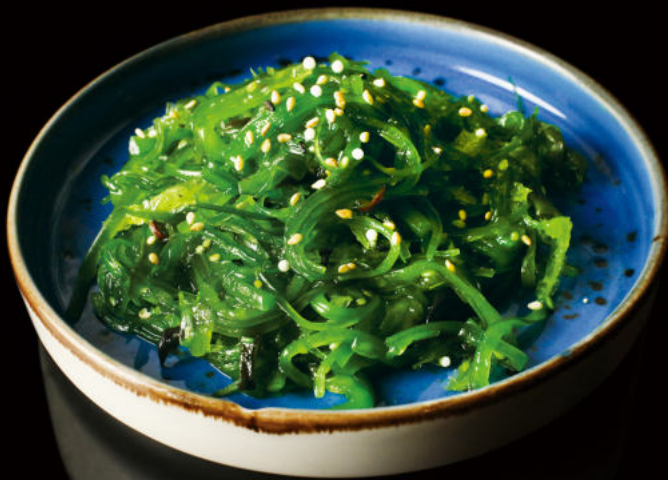
1. Wakame Seafood Salad