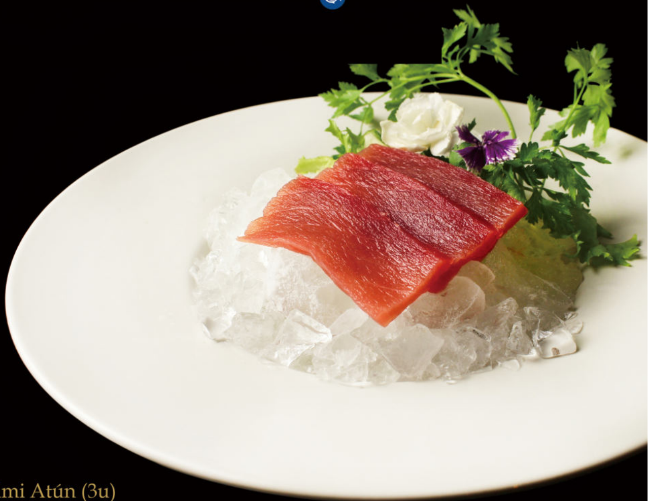
211.Sashimi Atún (3u) Sashimi Tuna (3u)