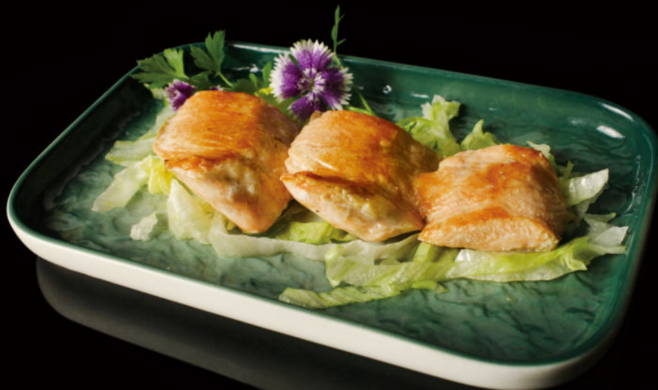
62. Sake de Salmón Grilled salmon