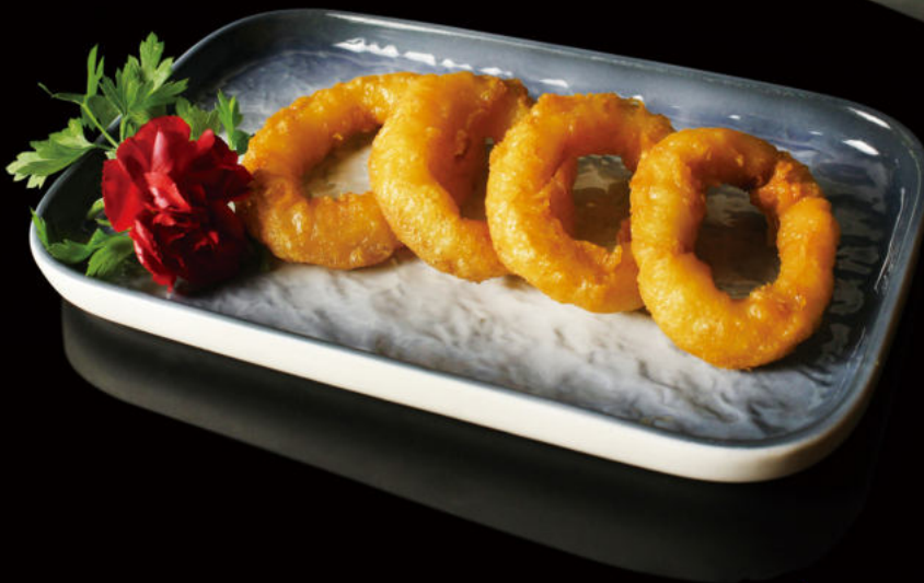
17. Calamares rebozados Breaded squid