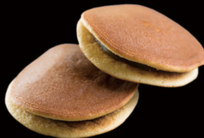
511. Dorayaki (chocolate, judía roja)