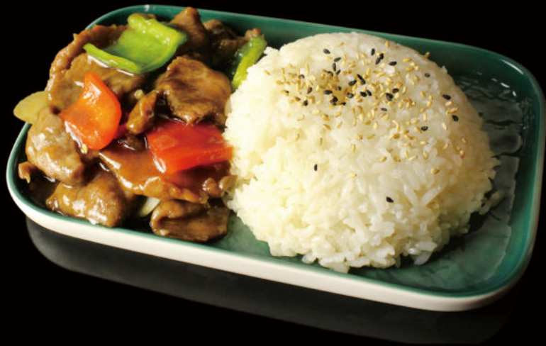
44. Donburi con Ternera Donburi with Beef