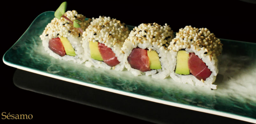
151. Atún, Aguacate y Sésamo Tuna, avocado and sesame