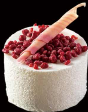
514.Chocolate blanco núcleo de fruto rojos White chocolate core of red fruit 4.95€