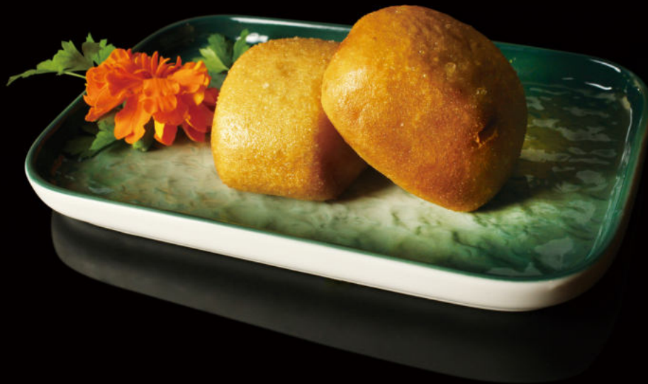
15. Panecillo japonés (2u) Steamed buns