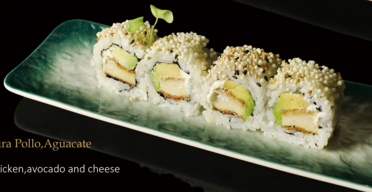
154. Tempura Pollo, Aguacate y Queso Tempura chicken, avocado and cheese