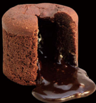
516.Soufflé de chocolate Chocolate soufflé 4.95€