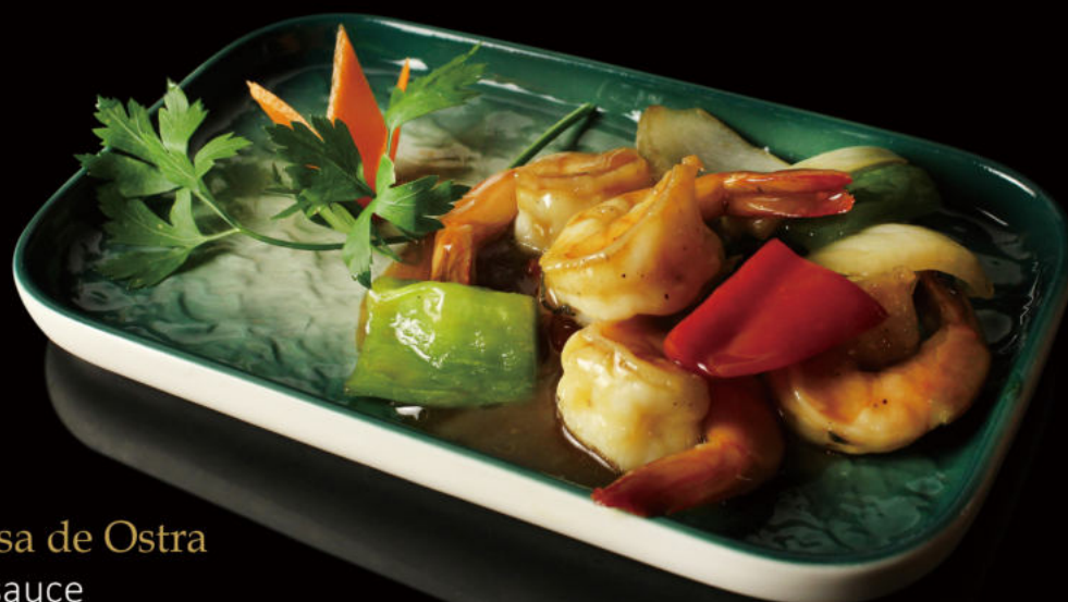
55. Gamba con salsa de Ostra Prawn with oyster sauce