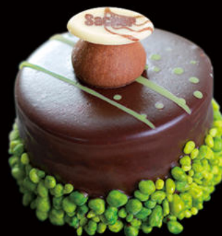
518 Sacher negra con té verde Sacher black with green tea 5.50€