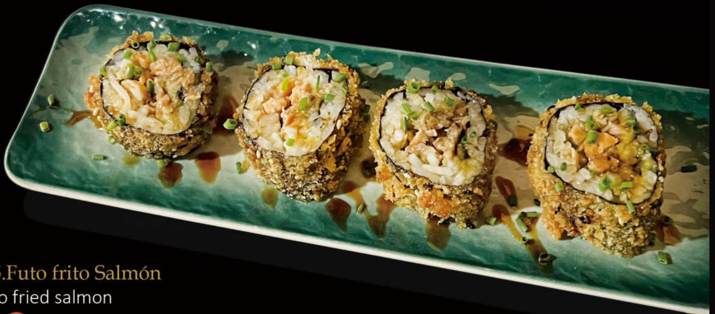
165.Futo frito Salmón Futo fried salmon