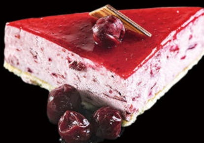
520.Fuji helado de cireres Fuji ice cream of cireres 4.50€