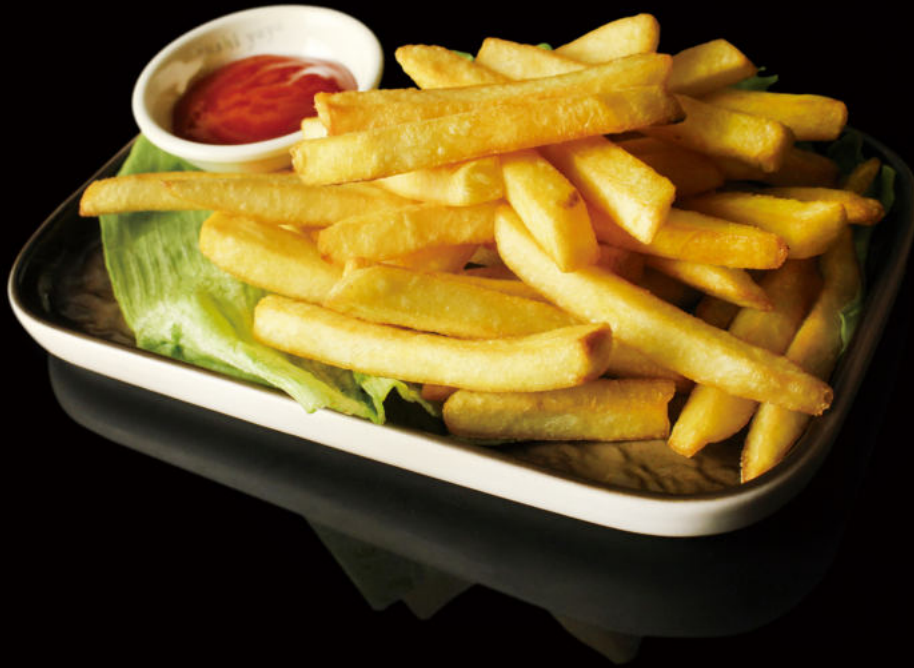
19.Patatas fritas French fries