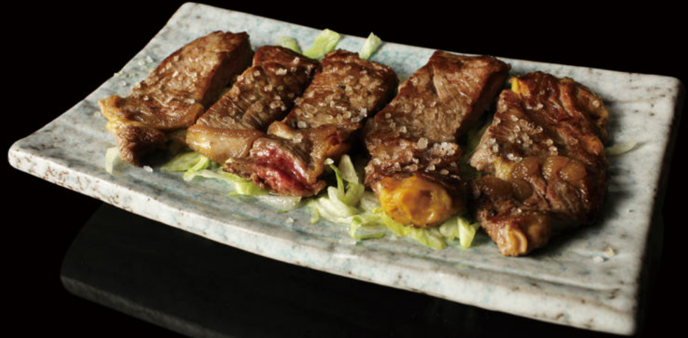
60. Bistec Steak