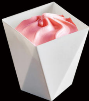
513.Helado (vainilla,sésamo,fresa,chocolate,te verde) Ice cream (vanilla, sesame, strawberry, chocolate, green tea) 2.25€