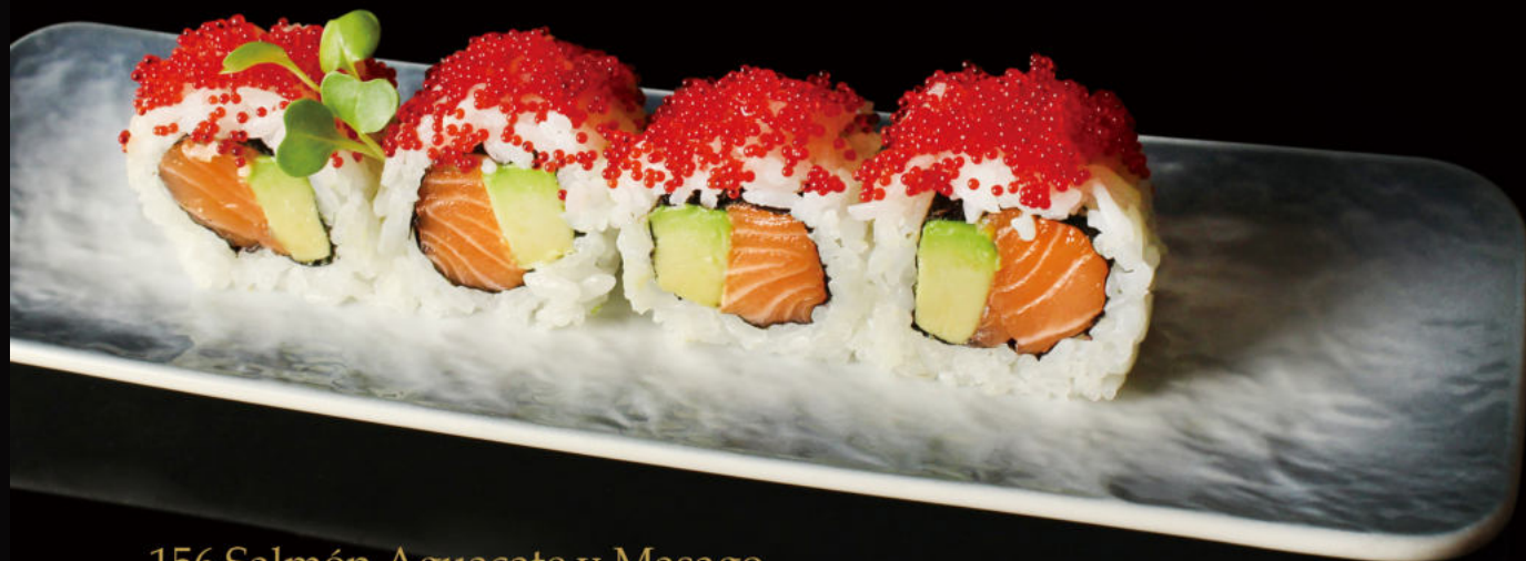
156.Salmón,Aguacate y Masago Salmon,avocado and masago