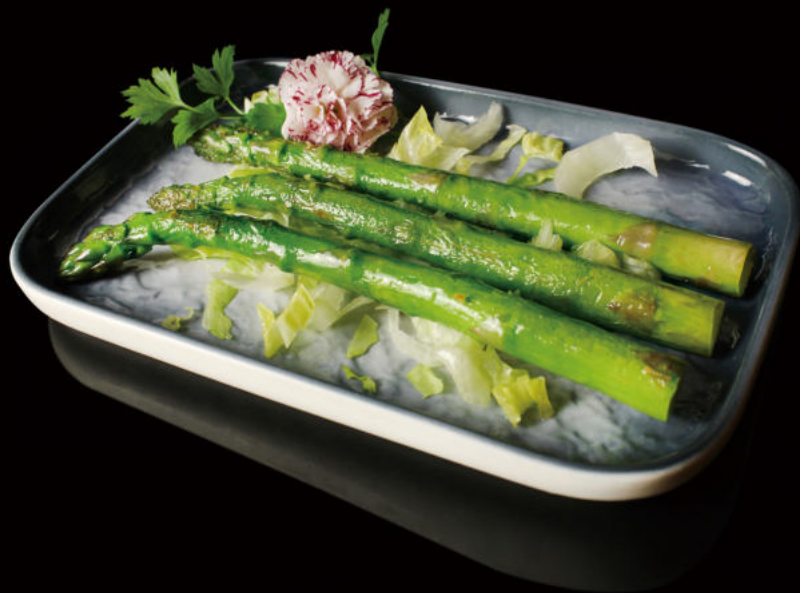
29.Esparragos a la plancha Grilled asparagus