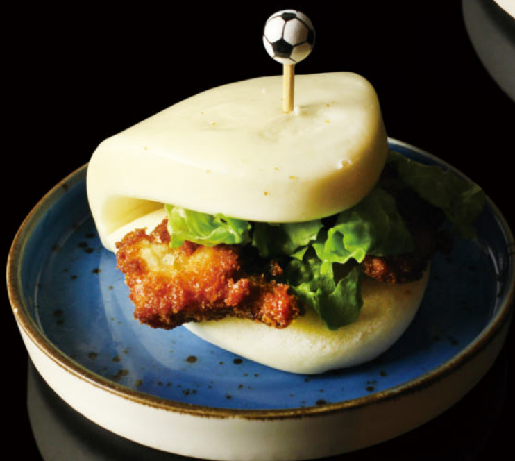
10.Guabao (1u) Guabao