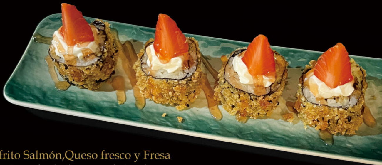
167. Futo frito Salmón, Queso fresco y Fresa Futo fried salmon, fresh cheese and strawberry