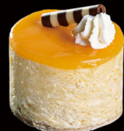
512. Crema catalana helado Catalan cream ice cream