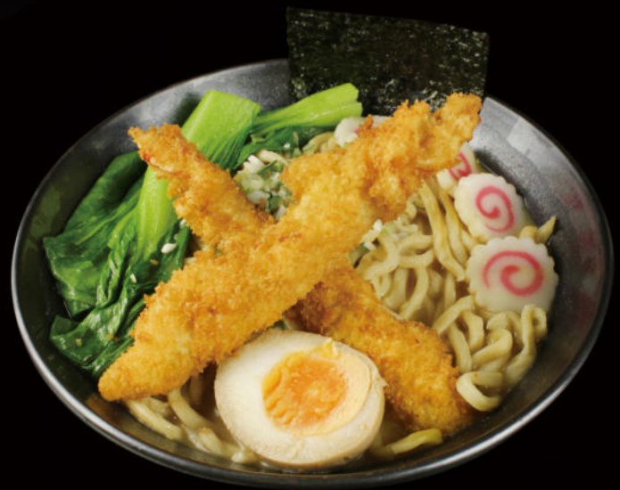
49. Ramen Pollo rebozado Ramen battered chicken