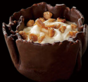
507. Too much vainilla y nueces de macadamia Too much vanilla and macadamia nuts