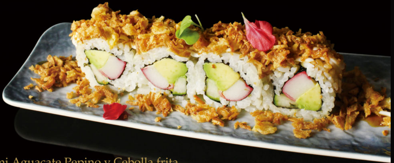
159.Surimi,Aguacate,Pepino y Cebolla frita Surimi,avocado,cucumber and fried onion