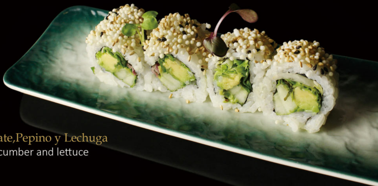
153. Aguacate, Pepino y Lechuga Avocado, cucumber and lettuce