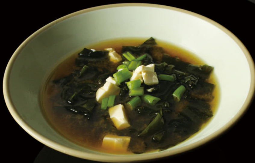
7.Sopa de miso Miso soup