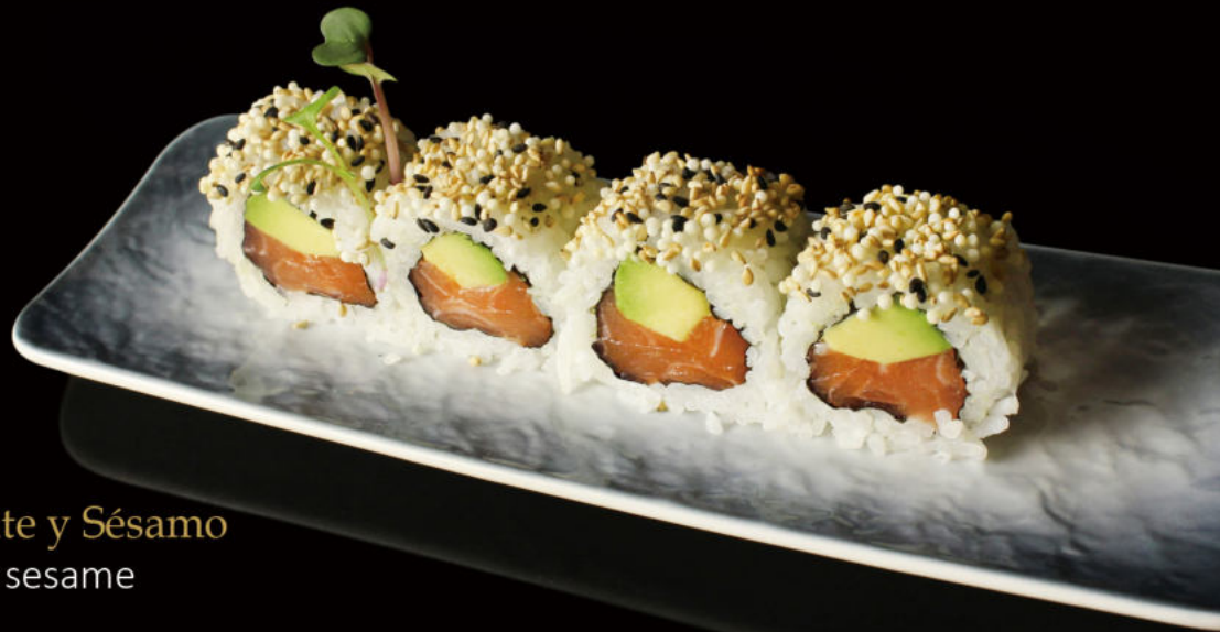
150. Salmón, Aguacate y Sésamo Salmon, avocado and sesame