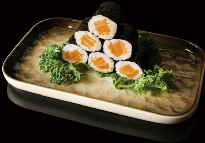
71.Salmón (8u) Salmon