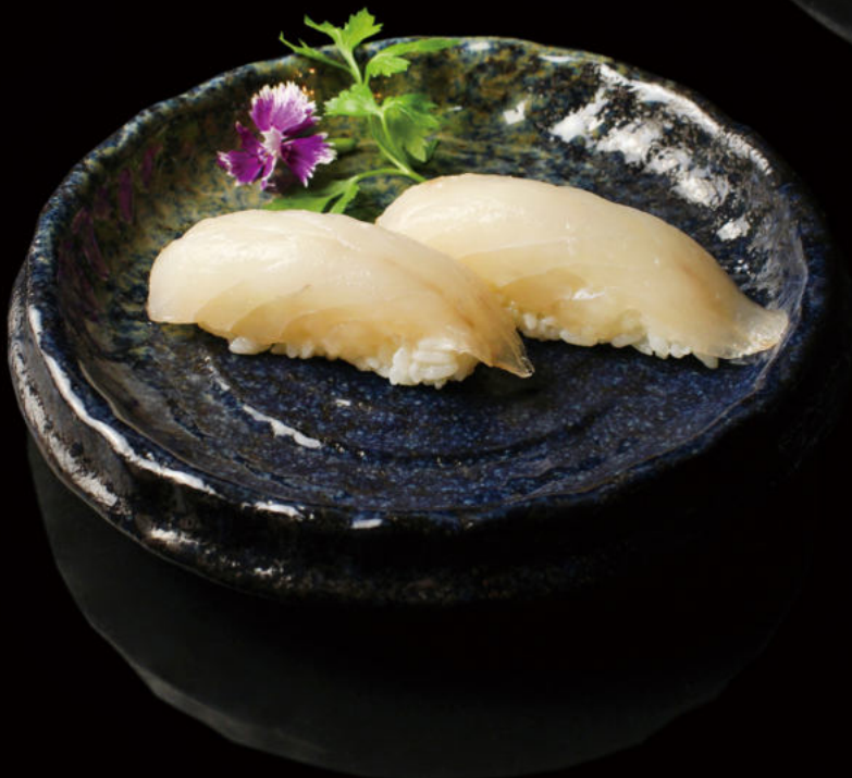
82.Lubina (2u) Bass