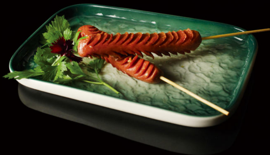
26. Salchicha Hot dog