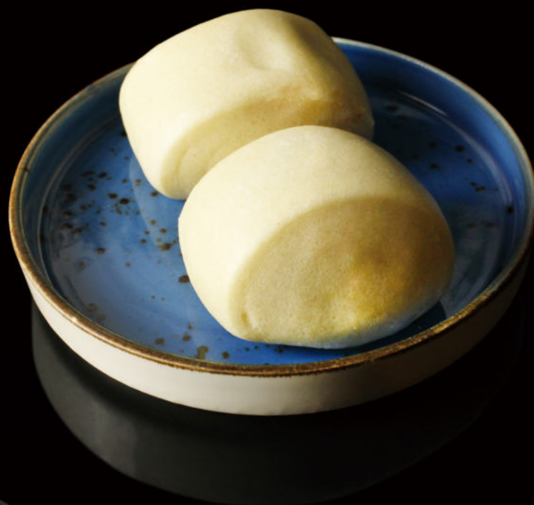
9.Pan al vapor Steamed bread