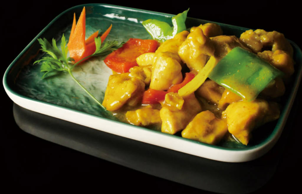
52. Pollo al curry Chicken curry