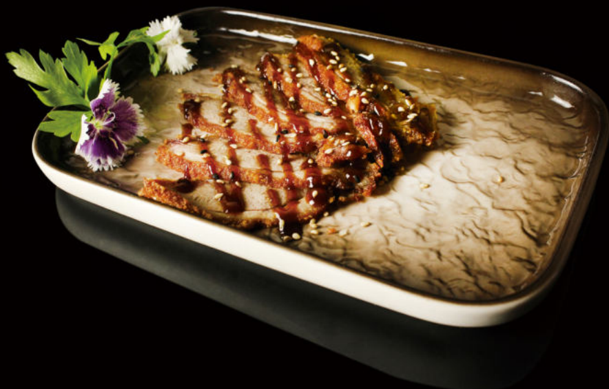
28. Pato asado Roasted duck