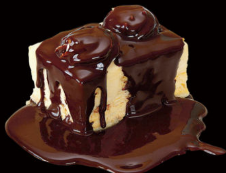
522.Biscuit crocant Crispy biscuit 4.50€