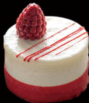
517.Sacher de chocolate blanco y fresa White chocolate and strawberry Sacher 5.95€