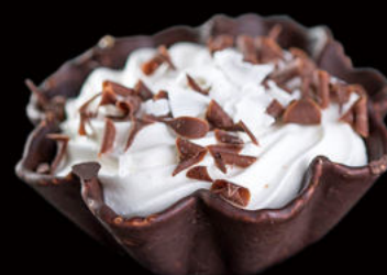
521.Coco-locos Coco-locos 4.50€