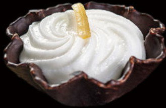
501. Helado flor de limón Lemon flower ice cream