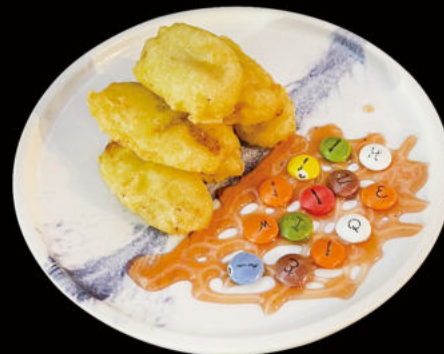
524.Plátano frito (Con nata +1€, flameado+1.95€) Fried banana (with cream +1€, flamed+1.95€) 3.95€