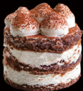
510. Tiramisu Tiramisu