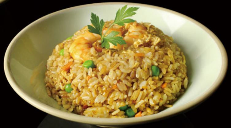
37. Arroz frito Gambas Shrimp fried rice