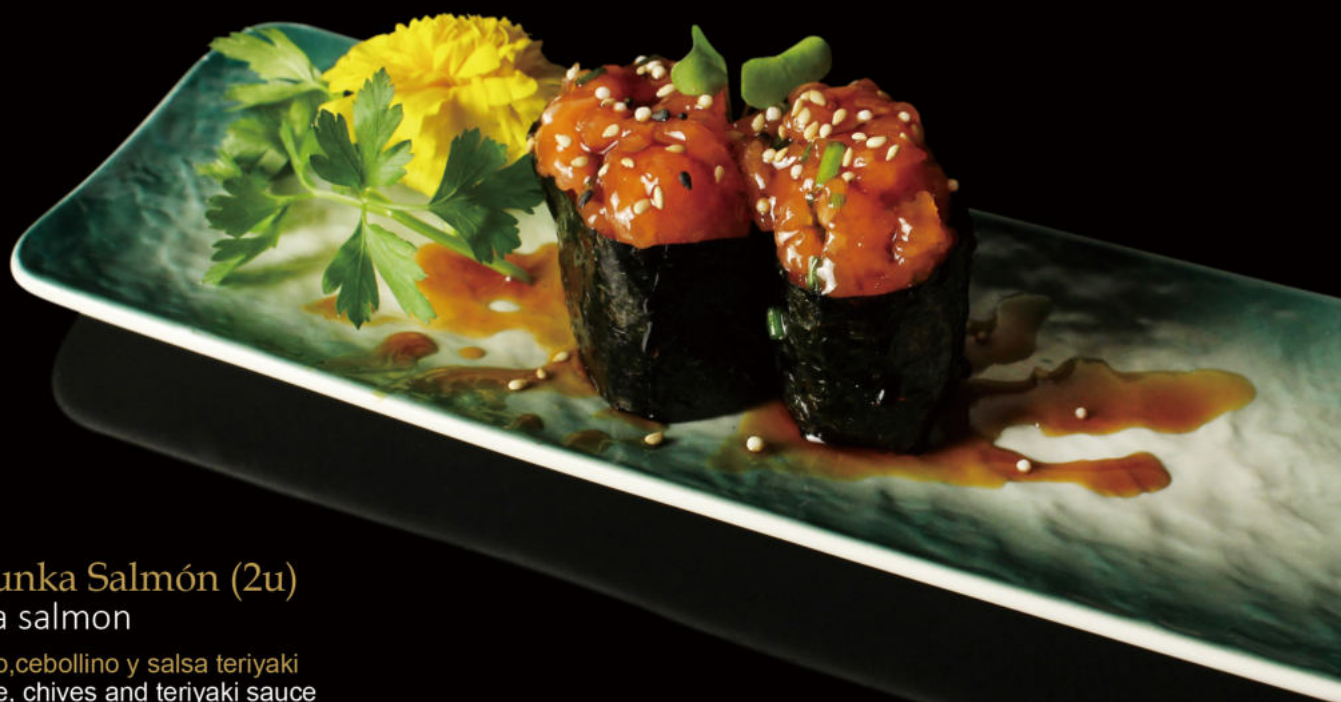
96.Kunka Salmón (2u)