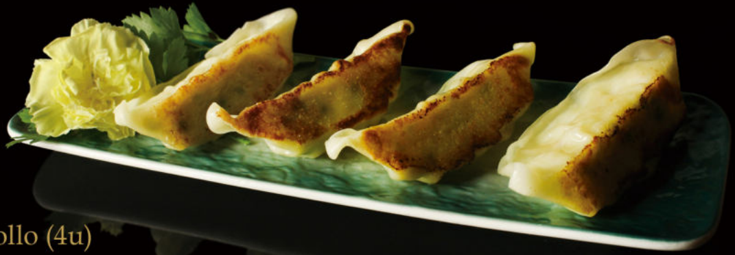
11. Gyoza de Pollo (4u) Chicken Gyoza