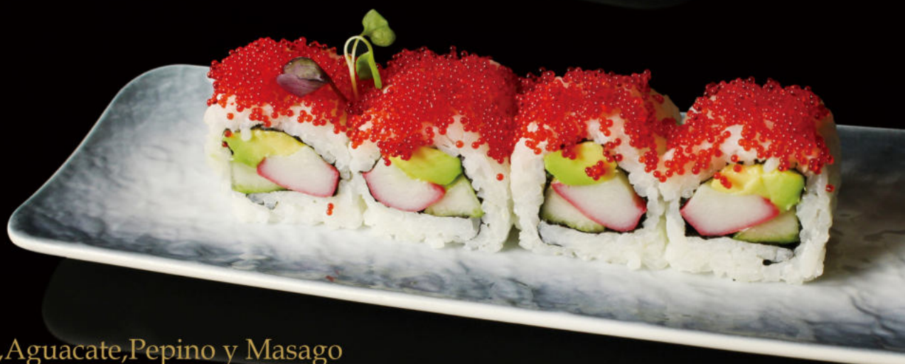
157.Surimi,Aguacate,Pepino y Masago Surimi,avocado,cucumber and masago