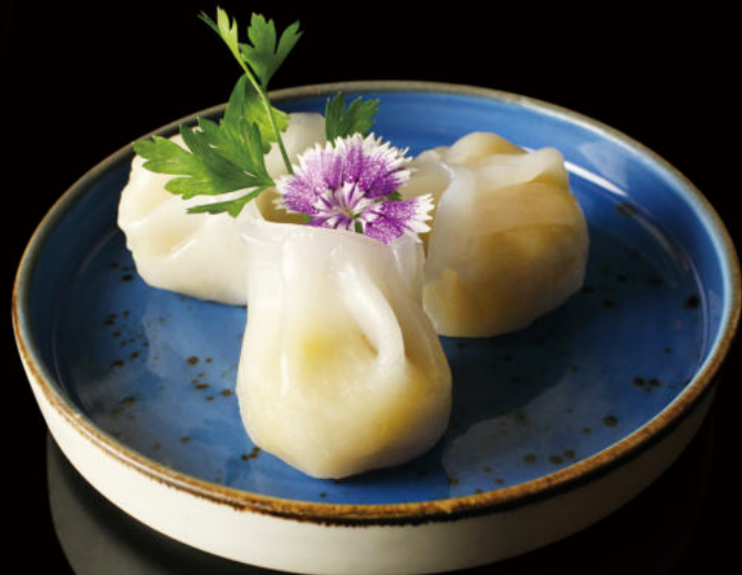
14. Crystal Gyoza de Gamba Crystal gyoza Gamba