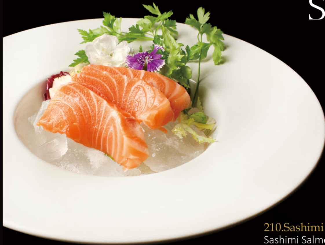
210.Sashimi Salmón (3u) Sashimi Salmon (3u)