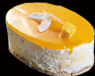
509. Coco y mango tentación helado Coconut and mango ice cream temptation