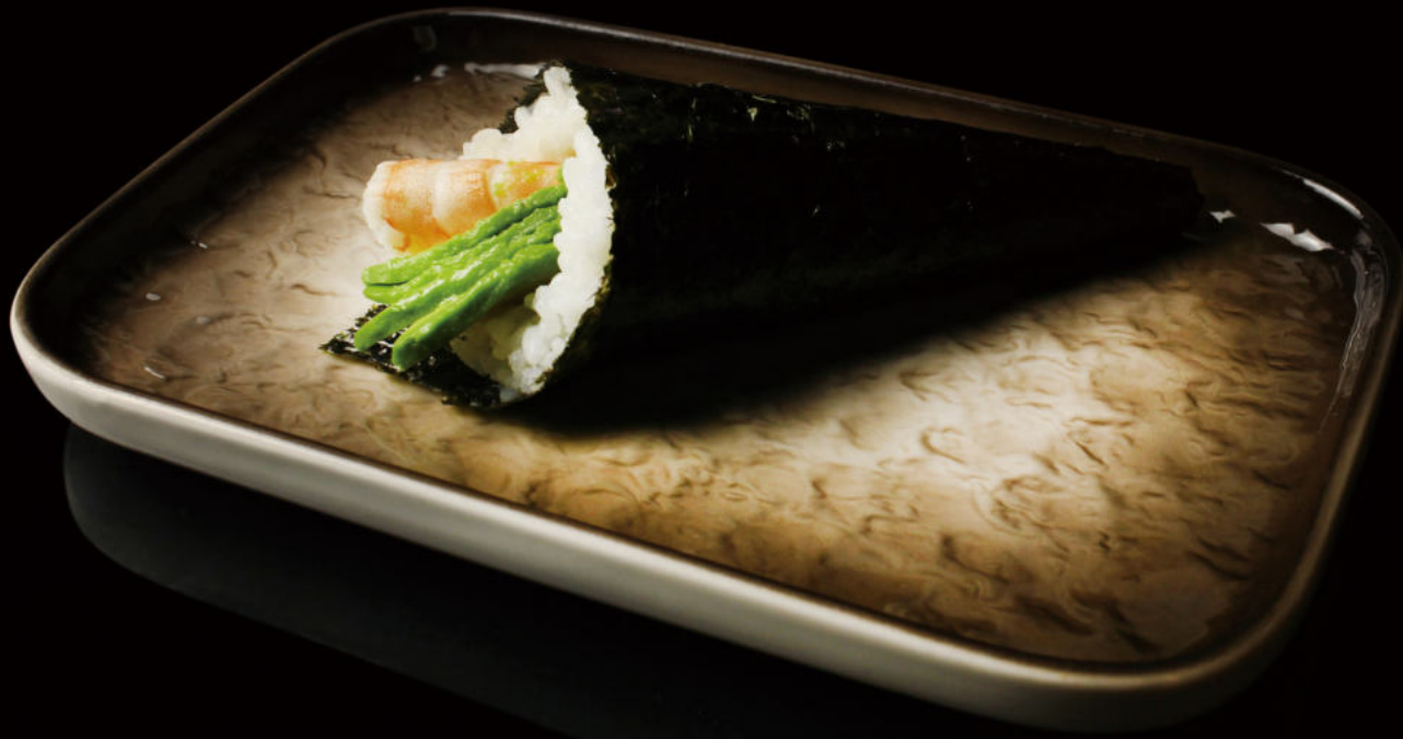
142. Langostino cocido y Aguacate Cooked prawn and avocado