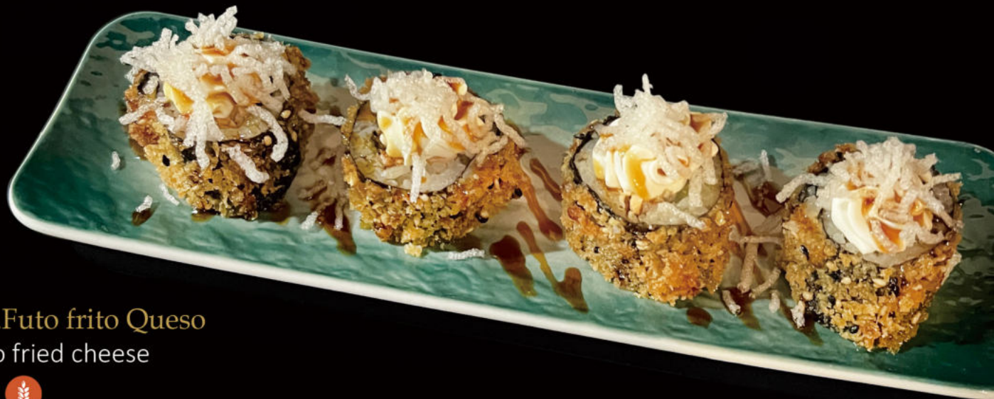
168. Futo frito Queso Futo fried cheese