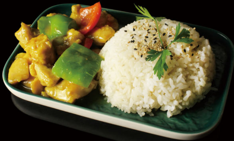
45. Donburi con Pollo curry Donburi with chicken curry