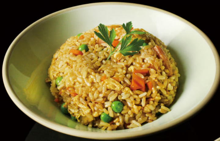
36. Arroz frito Yakimesi Yakimesi Fried Rice