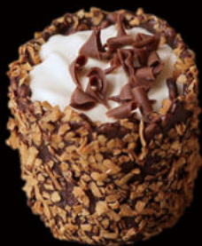
504. Convent baileys Convent baileys