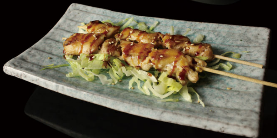
31.Pincho de Pollo (2u) Chicken skewer