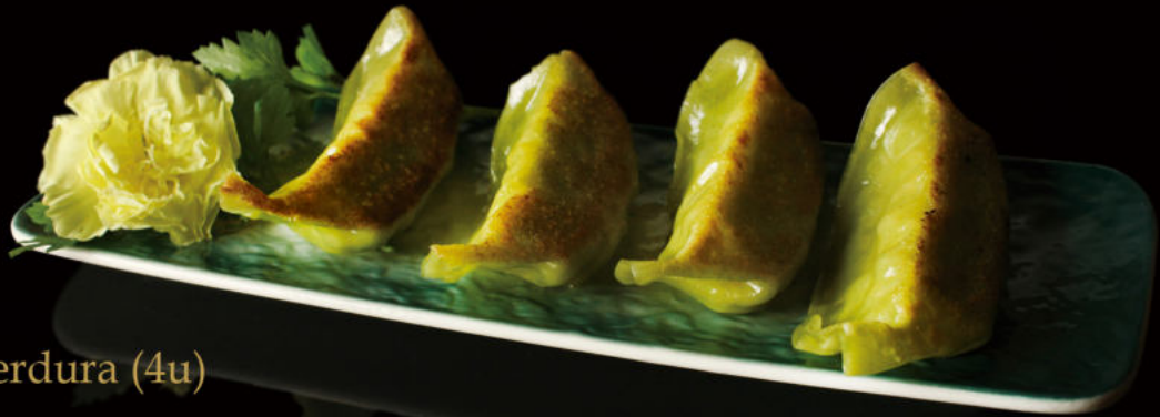
12. Gyoza de verdura (4u) Vegetable Gyoza