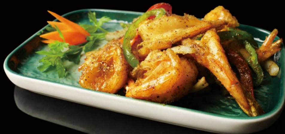
56. Gamba a la sal y pimienta Prawn with salt and pepper