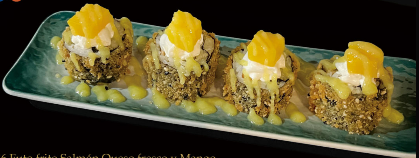
166.Futo frito Salmón,Queso fresco y Mango Futo fried salmon,fresh cheese and mango