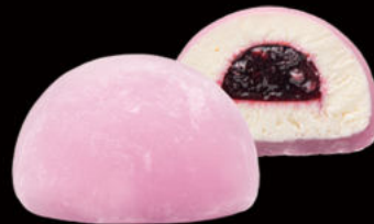
505. Mochi-daifuku (cheesecake, oreo, té verde, chocolate) (cheesecake, oreo, green tea, chocolate)