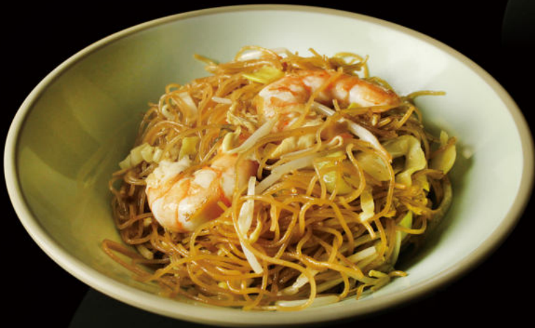
42. Yakiudon de Mariscos Seafood yakiudon