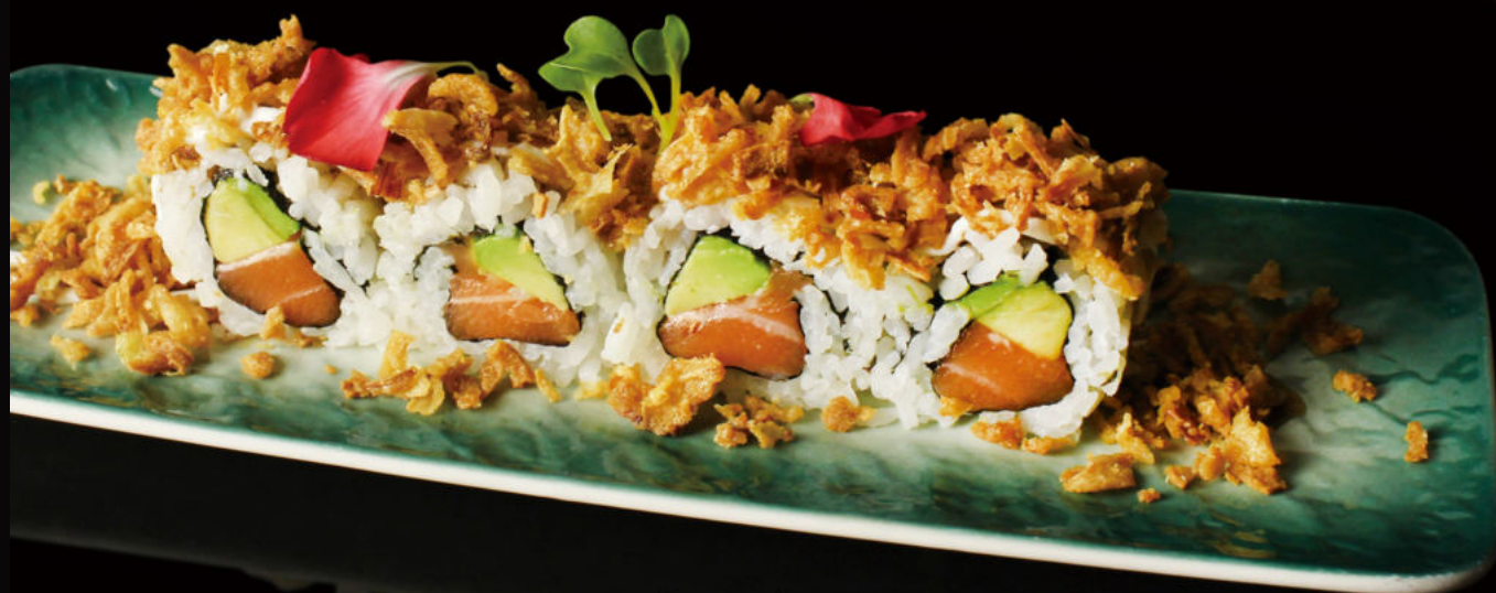
158.Salmón,Aguacate y Cebolla frita Salmon,avocado and fried onion