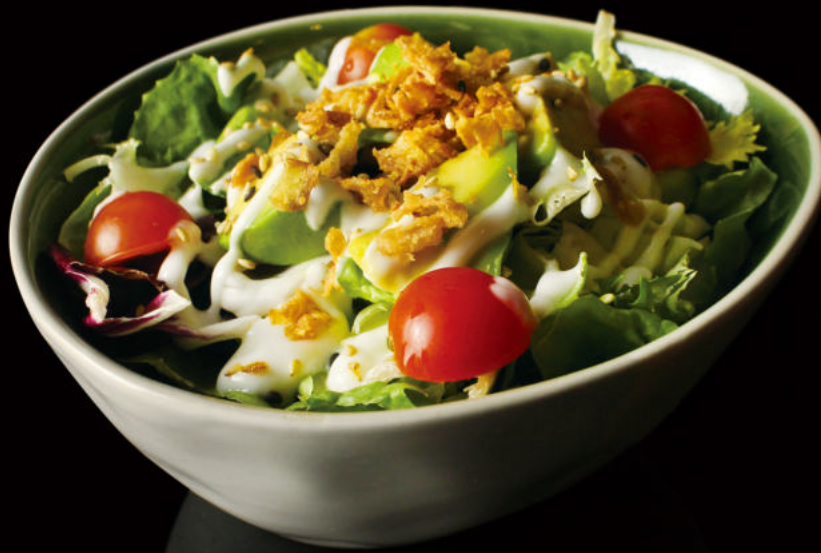
5.Ensalada de la casa Homemade Salad