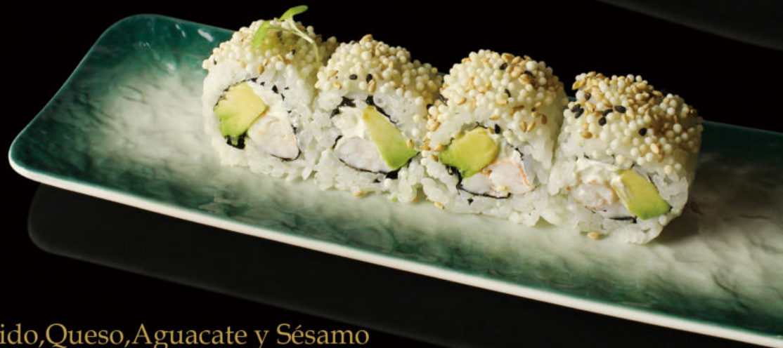
152. Langostino cocido, Queso, Aguacate y Sésamo Cooked prawn, cheese, avocado and sesame