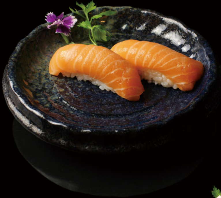
80.Salmón (2u) Salmon