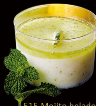
515.Mojito helado Mojito ice cream 4.50€