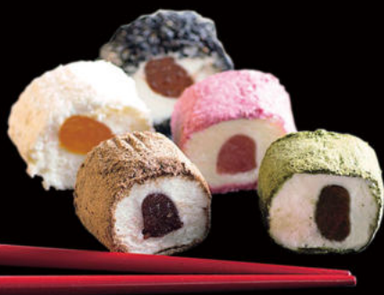
519.Makis deliciosas helado Maki delicacies ice cream 5.95€