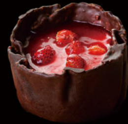
503. Too much fresitas del bosque Too much forest strawberries